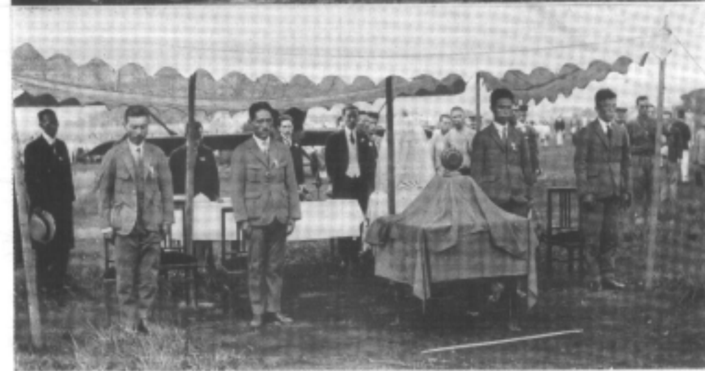
殿宮院開たれさば遊場臨御折の發出本々代は内閣精。開路飛行機歐訪の備主新聞新日朝は圖上 てつ向。士勇西の歐訪は圖下。風初が左風東が右てつ向。機歐訪は圖中。下殿宮通久と下 。士閣機取修、士從探邊安、士從探内河、士風機弱片、りよ右