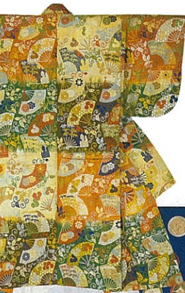
紅・萌黄・黒・白段扇に 唐草文唐織