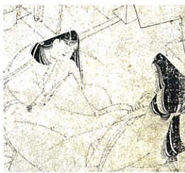
重要文化財 源氏物語絵詞(部分)