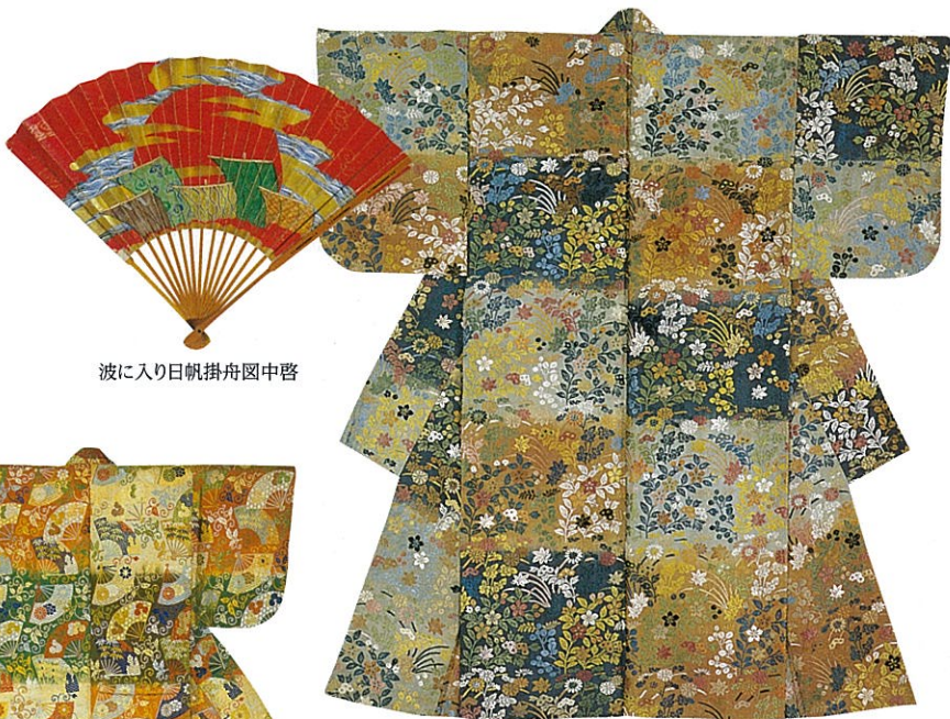
波に入り日帆掛舟図中啓