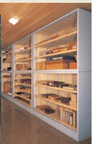
天理図書館 正面と貴重書庫