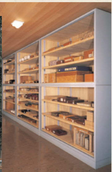
天理図書館 正面と貴重書庫