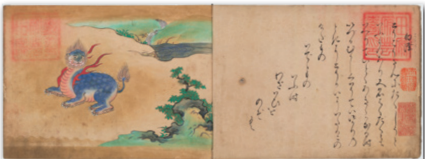
影印本文見本 (A4判横)

中国の各地に生息するとされる動物や、その地に奉られている神々について、神類・獸類・魚類・虫類の四類四冊に百十三図の絵を収め、各々に説明文を添えたもの。異形怪異な絵が散見され、中国古代の地理書である『山海経図』の類を参考にして、取捨選択したものと思われる。江戸期における『山海経』受容の一端が伺える資料である。各冊の巻頭には、徳川御三卿の一つである田安家の蔵書印「田安府芸台印」が捺される。