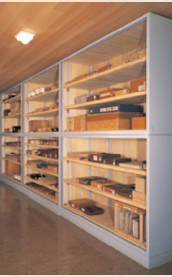
天理図書館 正面と貴重書庫