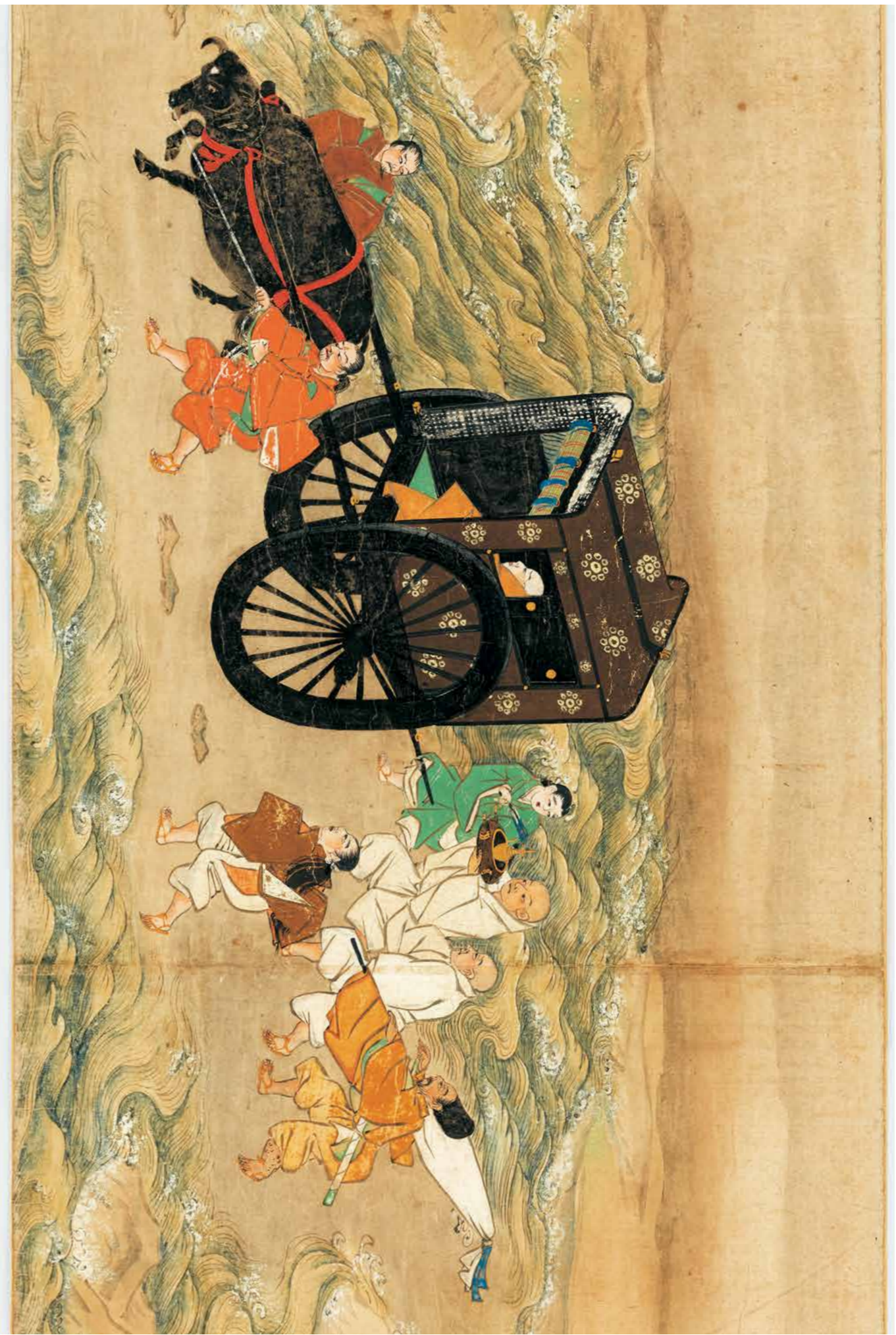
在柄天神縁起 卷中 第七段 絵尊意鴨川渡水の事