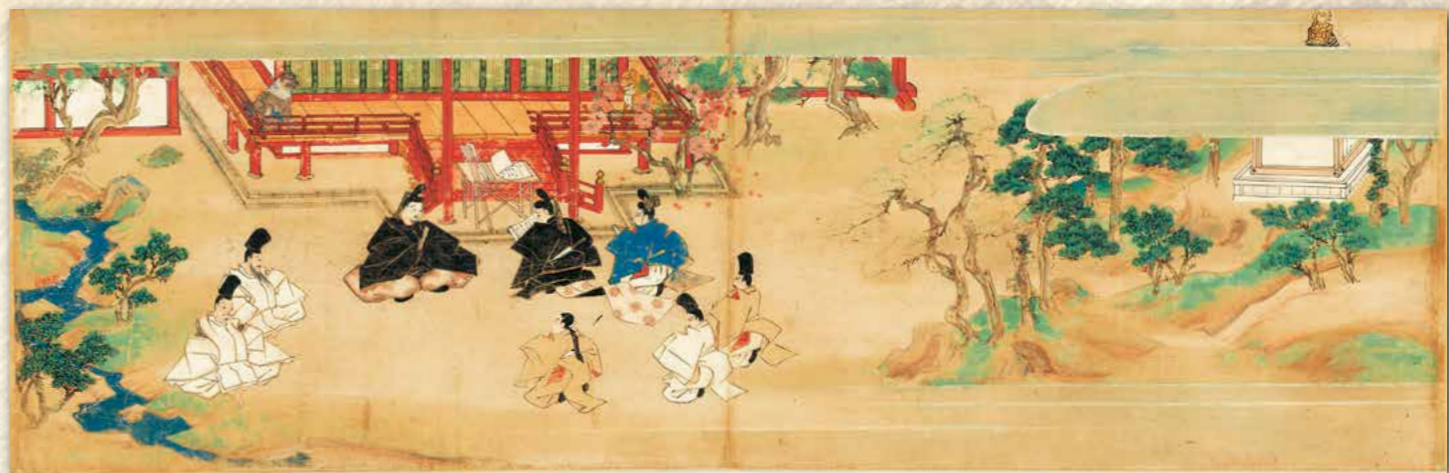
荏柄天神縁起【重要文化財】 巻下 第五段 官位追贈の事

前田育徳会尊経閣文庫といえば、古典籍類を中心に、貴重書の宝庫として、国文学や歴史学の分野では著名な存在だろう。いっぽうで、同文庫には多くの絵画作品が所蔵されていることはあまり知られていないかもしれない。今般、尊経閣善本影印集成として刊行される四つの絵巻作品は、尊経閣文庫を代表する絵画作品としてのみならず、日本の中世絵画史を考える上でも極めて重要な位置を占める作品である。 荏柄天神縁起 は、北野天神縁起絵巻の伝本の一つで、もとは鎌倉・荏柄天神社に伝来した。前田家は菅原姓を名乗ったため天神信仰が篤く、そのゆかりから前田家に所蔵されることになった。尊経閣文庫の絵巻作品を紹介するシリーズとしては巻頭を飾るにふさわしい作品である。 一遍聖絵 は、国宝の同作品（神奈川・清浄光寺、東京国立博物館）と合わせて深い関係にある作例として注目されてきた。国宝本と詞書や絵の構図等、ほぼ同様の構成だが、細部において異なる箇所もある。国宝本の草稿本、転写本といった説が唱えられてきたが、こうした点もこの度の刊行により大きく研究が進むことだろう。 豊明絵草紙 は、類本のない鎌倉時代の白描絵巻。鎌倉時代には白描の物語絵巻の優品が数多く制作されたが、本作はそうした白描絵巻絶頂期からやや時代をおいて制作されたものとみなされてきた。後世の補筆等が一部に確認されるが、オリジナルの描線を丁寧にとどめるならば、本作がまさに絶頂期の白描絵巻であることが再認識されると思う。詳細な画像でご確認いただきたい。 祭礼草紙 は、詞書のない、祭礼行列を中心とした作品。小絵と呼ばれる、通常の絵巻の半分ほどのサイズの作品だが、小さな画面に抜き取り描かれた描写には驚くほど多くの情報が込められている。室町時代中期土佐派の手になるものと推察され、茶道や芸能のみならず、絵画史上も重要な位置を占める作品である。 これらの絵巻作品は、戦前に刊行された尊経閣叢刊で一部の作品が取り上げられたが、その後、全巻の詳細な画像は公刊されていない。今回の集成では、高精度撮影されたデジタル画像に基づき、各作品の大型の図版が掲載される。これらの画像は絵画史のみならず、周辺分野の研究においても大いに資するものと考えられる。刊行を企画された前田育徳会に謝意を申し上げるとともに、この学恩をぜひ多くの方々と分かち合いたいと願っている。