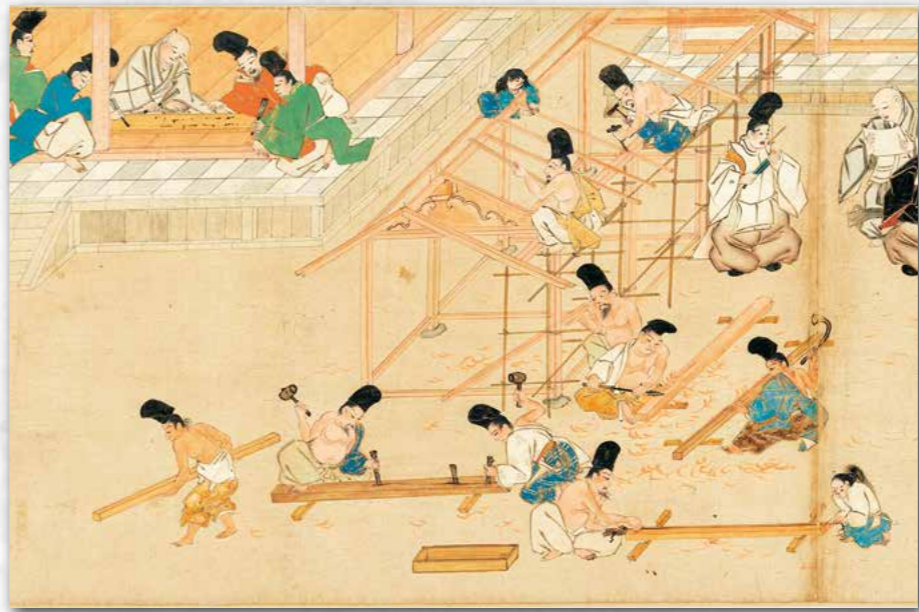
荏柄天神縁起 巻下 第四段 内裏造営の事