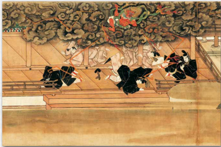
荏柄天神縁起 巻中 第十段 清涼殿落雷の事

菅原道真の生涯と北野社（現在の北野天満宮）創建に至るまでの経緯を描く北野天神縁起絵巻の一本。「荏柄天神縁起」の名称は、もと鎌倉の荏柄社に由来した北野天神縁起であることによるもので、元禄年間ごろに同社の別当一乗院から前田家に入ったものとされる。上中下三巻からなっており、上巻十一段は道真の幼少時から大宰権帥への左遷と九州下向までを、中巻十三段は配所における道真の生活と失意の中の逝去、没後の数々の祟りや日蔵の冥土めぐりを、下巻十三段は北野社創建と数々の霊験を描く。奥書には元応元年（一二三九）、藤原長長によって奉納されたと記されている。北野天神縁起絵巻諸本のうち、「根本縁起」と称される承久本の系譜を引く完本の一つとして貴重である。